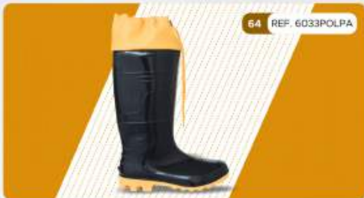
64 REF. 6033POLPA