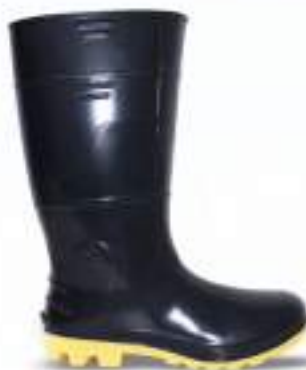
67 REF. 6033PA

BOTA PVC KADESH SAFETY BOOTS 33 CM CA 42149 - SEM BIQUEIRA