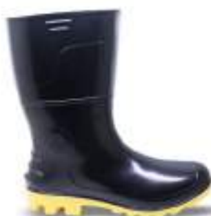
70 REF. 6026PA

BOTA PVC KADESH SAFETY BOOTS 28 CM CA 42149 - SEM BIQUEIRA