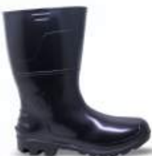
69 REF. 6026P

BOTA PVC KADESH SAFETY BOOTS 33 CM CA 42149 - SEM BIQUEIRA