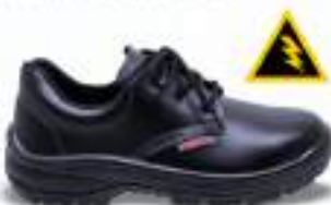
34 REF. 3502

SAPATO ELÁSTICO KADESH MICRO K CA 40880 - COMPOSITE CA 40885 - POLIPROPILENO