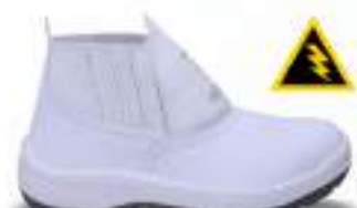
39 REF. 3500B

BOTINA 3 GOMOS KADESH MICRO K CA 46325 - COMPOSITE CA 46285 - POLIPROPILENO