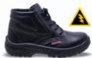
36 REF. 353G

BOTINA 3 GOMOS KADESH MICRO K CA 46325 - COMPOSITE CA 46285 - POLIPROPILENO