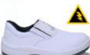
37 REF. 3501B

TÊNIS AMARRAR KADESH MICRO K CA 42604 - COMPOSITE CA 42616 - POLIPROPILENO