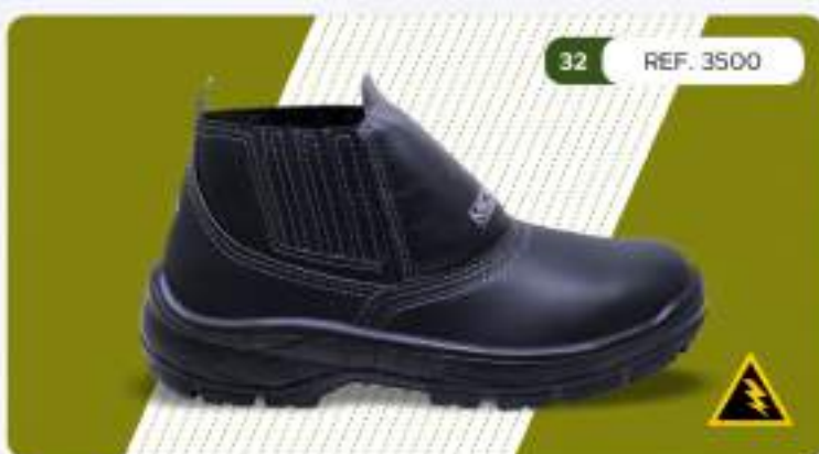
32 REF. 3500