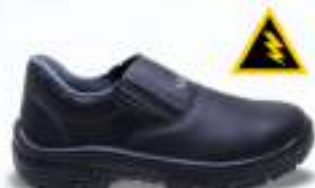
33 REF. 3501

BOTINA ELÁSTICO KADESH MICRO K CA 46270 - AÇO CA 40881 - COMPOSITE CA 40877 - POLIPROPILENO