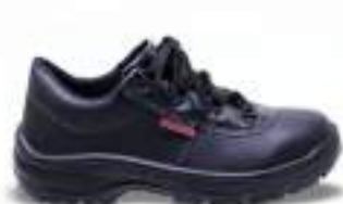
35 REF. 352TN

SAPATO AMARRAR KADESH MICRO K CA 42604 - COMPOSITE CA 42616 - POLIPROPILENO