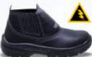
32 REF. 3500

BOTINA ELÁSTICO KADESH MICRO K CA 46270 - AÇO CA 40881 - COMPOSITE CA 40877 - POLIPROPILENO