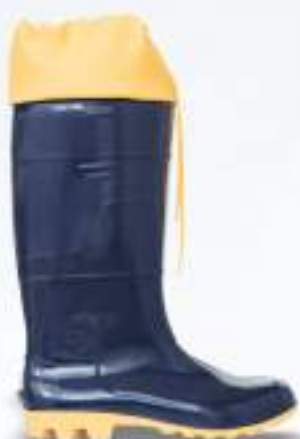
65 REF. 6033POLAZ

BOTA PVC KADESH SAFETY BOOTS 33 CM + POLAINA CA 42149 - SEM BIQUEIRA