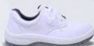
31 REF. 3002B

SAPATO ELÁSTICO KADESH PREMIUM BRANCA CA 38228 - AÇO CA 33733 - POLIPROPILENO