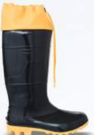
64 REF. 6033POLPA

BOTA PVC KADESH SAFETY BOOTS 33 CM + POLAINA CA 42149 - SEM BIQUEIRA