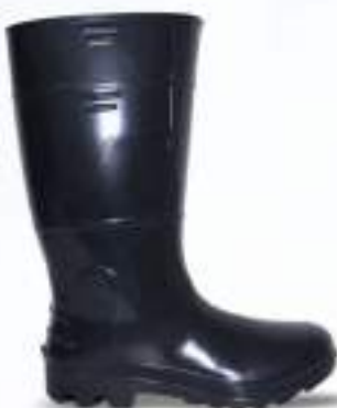
66 REF. 6033P

BOTA PVC KADESH SAFETY BOOTS 33 CM + POLAINA CA 42149 - SEM BIQUEIRA