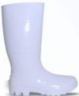
68 REF. 6033B

BOTA PVC KADESH SAFETY BOOTS 33 CM CA 42149 - SEM BIQUEIRA