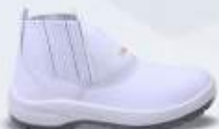
29 REF. 3000B

BOTINA ELÁSTICO KADESH PREMIUM BRANCA CA 38535 - AÇO CA 33734 - POLIPROPILENO