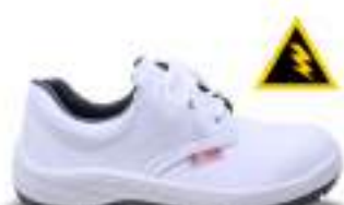
38 REF. 3502B

SAPATO ELÁSTICO KADESH MICRO K BRANCA CA 40879 - COMPOSITE CA 40886 - POLIPROPILENO