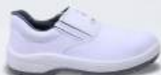
30 REF. 3001B

BOTINA ELÁSTICO KADESH PREMIUM BRANCA CA 38535 - AÇO CA 33734 - POLIPROPILENO