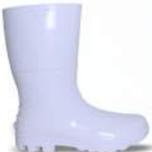
71 REF. 6028B

BOTA PVC KADESH SAFETY BOOTS 33 CM CA 42149 - SEM BIQUEIRA